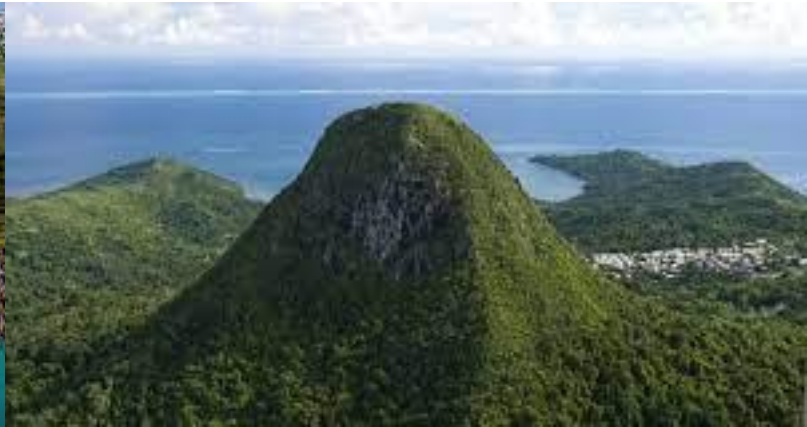
Mont Choungi, grande terre

Mayotte est un archipel de l'océan indien situé entre Madagascar et la cote du Mozambique. Elle est le fruit de la réunion de deux édifices volcaniques dont la genèse remonte à plus de 20millions d'années.