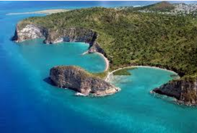
Plage de moya, petite terre